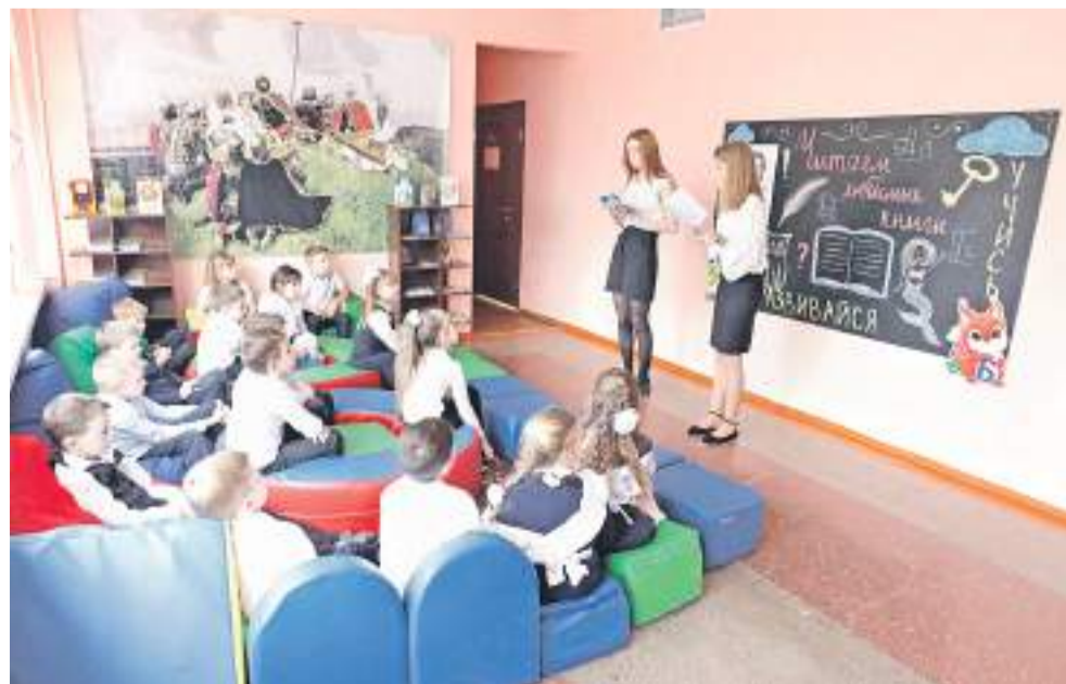
В рамках проекта «Дети — детям» старшеклассники читают книги ученикам начальной школы (Ровеньская школа с углублённым изучением отдельных предметов)