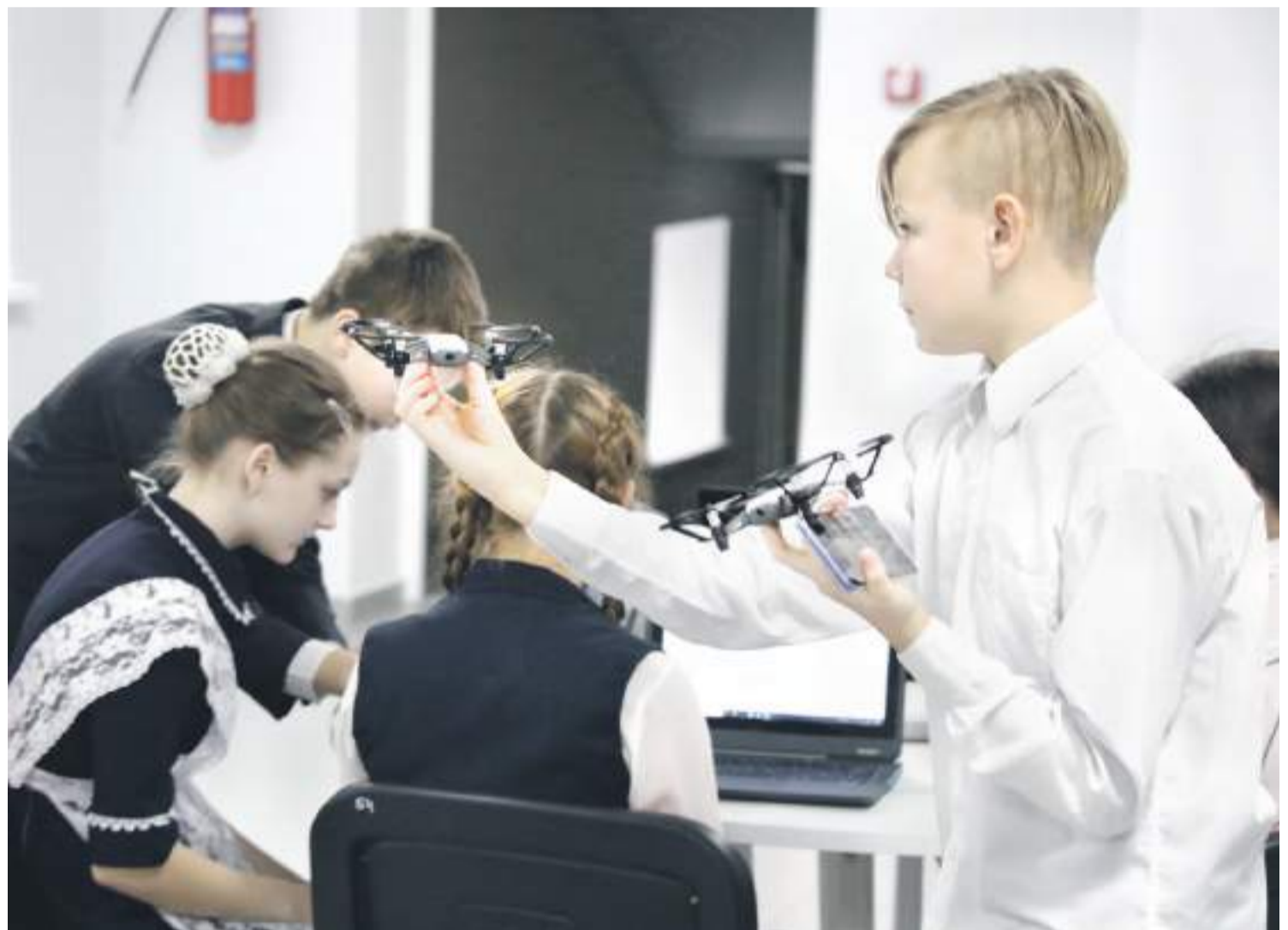
Квадрокоптерами сейчас даже в сельской школе никого не удивишь. С ними легко справляются в «Точке роста» Ровеньской школы № 2

На занятии внеурочной деятельности у младших школьников «Начинаем изучать английский язык» нам показали, как можно использовать флеш-карты (не компьютерные флешки, а карточки