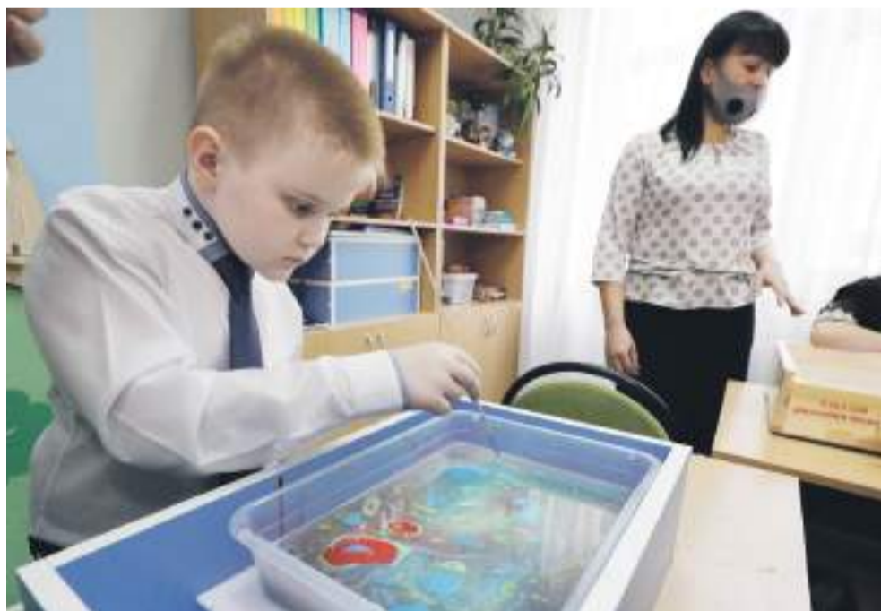
Занятие по акваанимации в Новоалександровской школе

Дальше директор ведёт нас в «деревню Йогуртово». Она расположилась в обычном классе, только вместо учебников и ручек на столе — йогурты, фрукты и другие начинки и добавки.