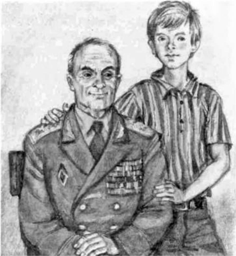
Иллюстрация к повести «Мой генерал» художника Юрия Иванова

ЧИТАТЬ СТАТЬЮ «ИСКАТЬ ДОБРО ВОКРУГ СЕБЯ» О КНИГЕ «НЕЗАБЫТЫЕ ИГРУШКИ»