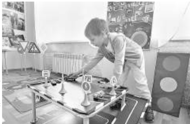
В детском саду «Сказка» пос. Ивня