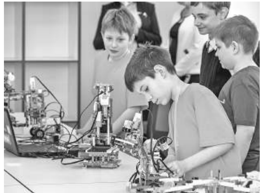
Студия робототехники Шуховского лицея