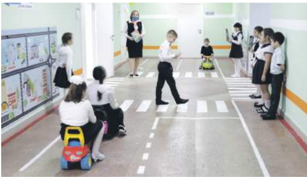
Занятия в образовательной зоне «Правила движения достойны уважения!» в школе № 2

ского творчества. Здесь занимаются и младшие школьники, для которых конструирование роботов — уже привычное дело. Как и для учеников школы с УИОП: в зависимости от возраста детей здесь действует два объединения дополнительного образования — «Робототехника» и «Введение в робототехнику».