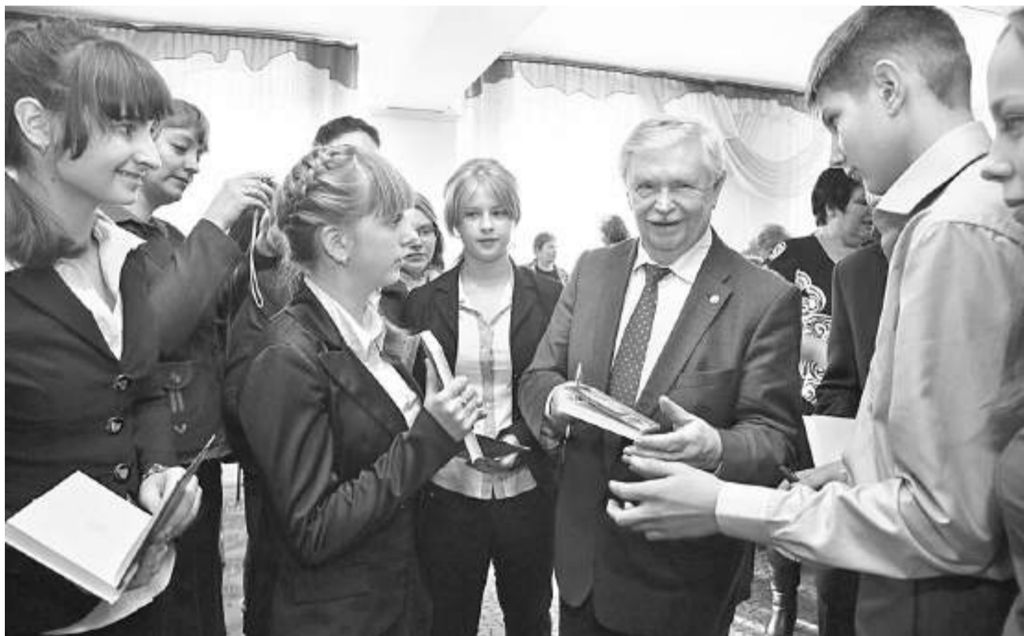
Альберт Лиханов в Грайворонской районной библиотеке

ПОЧЕМУ ЧИТАТЕЛЕЙ ПРОИЗВЕДЕНИЙ АЛЬБЕРТА ЛИХАНОВА МОЖНО НАЗВАТЬ НРАВСТВЕННЫМИ ЛЮДЬМИ