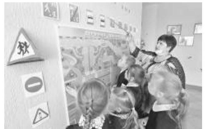
В Клименковской школе Вейделевского района

действию этих мероприятий на конкретного ребёнка сиюминутно, потому что результат, как правило, отдалён во времени, к тому же отсутствуют измерители воспитанности и сформированности навыка поведения на дороге. Но ни одна школа не стоит в стороне от этой работы.