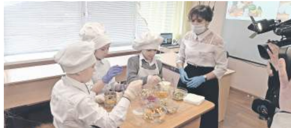
На внеурочке, посвящённой правильному питанию, ученики школы с УИОП готовят вкусные и полезные блюда