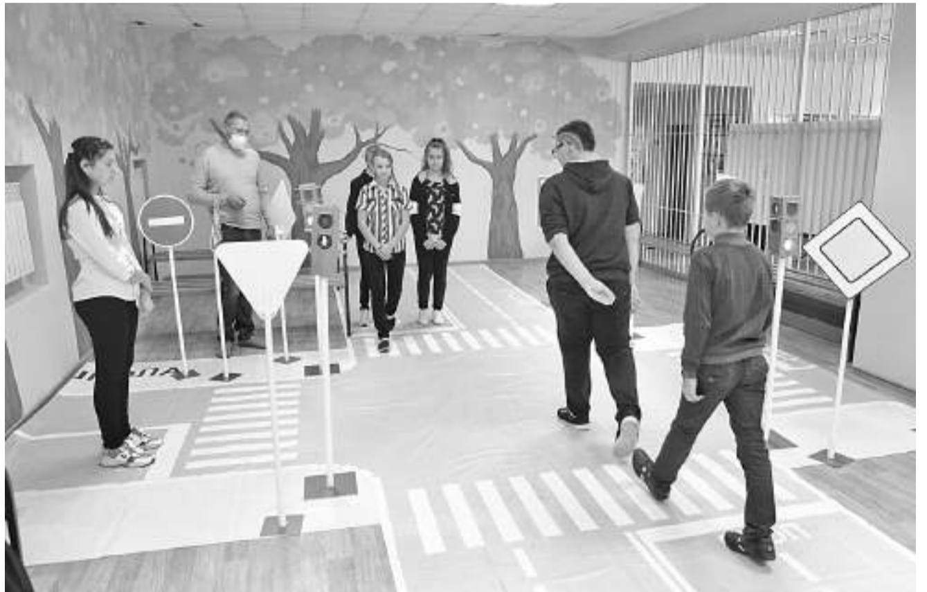
В Курасовской школе Ивнянского района

В наших школах во второй половине дня организованы пятиминутки безопасности перед уходом школьников домой, просмотр видеороликов, выступления агитбригад, проведение интеллектуально-познавательных и сюжетно-ролевых игр, целевых прогулок и экскурсий. Белгородская область принимает участие во всех всероссийских мероприятиях, которые рекомендованы Министерством просвещения Российской Федерации. Мы не можем делать выводы о воспитательном воз-