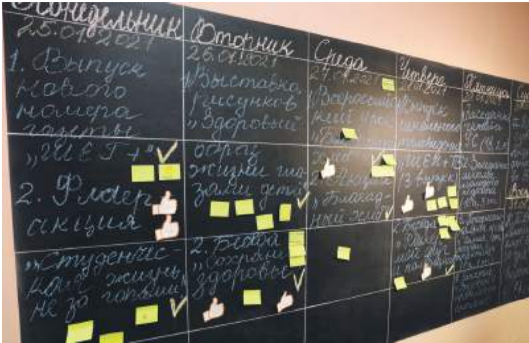
«Говорящая» стена в школе с УИОП