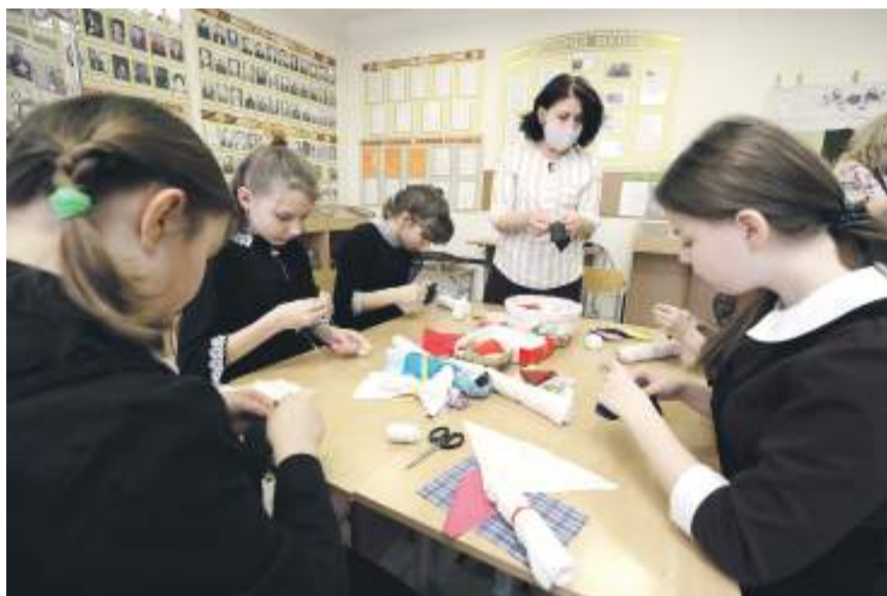
В рамках программы «Народная и авторская кукла» ученицы Новоалександровской школы учатся шить куклу-столбушку