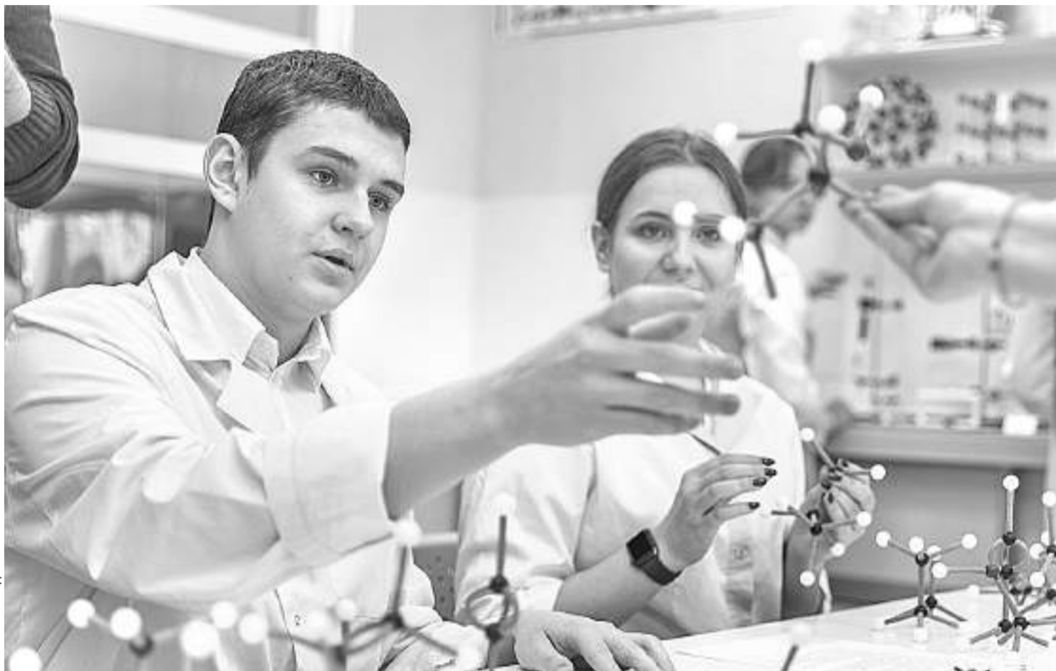
В химической лаборатории Шуховского лицея

В СОЦИАЛЬНЫХ СЕТЯХ ПОЯВЛЯЛОСЬ МНОГО СООБЩЕНИЙ О ТОМ, ЧТО СИТУАЦИЯ С КОРОНАВИРУСОМ — ЭТО ОСНОВАНИЕ ДЛЯ ПЕРЕВОДА ВСЕЙ СИСТЕМЫ ОБРАЗОВАНИЯ В ДИСТАНЦИОННЫЙ ФОРМАТ НА ПОСТОЯННОЙ ОСНОВЕ. УБЕЖДАТЬ НАРОД, ЧТО ТАКИЕ ЗАЯВЛЕНИЯ ОДНОЗНАЧНО БЕСПОЧВЕННЫ, НАМ СУЩЕСТВЕННО ПОМОГАЛ ОПЫТ ШКОЛ РАН, КОТОРЫЕ ПРОДЕМОНСТРИРОВАЛИ, ЧТО ОБРАЗОВАНИЕ — НЕ ТОЛЬКО ПРИОБРЕТЕНИЕ СУММЫ ЗНАНИЙ, НО ЭТО, ПРЕЖДЕ ВСЕГО, СОЦИАЛИЗАЦИЯ РЕБЯТ, ПЕРЕДАЧА ОПЫТА ПОКОЛЕНИЙ, ДУХОВНО-НРАВСТВЕННЫХ ЦЕННОСТЕЙ, ЧТО ЯВЛЯЕТСЯ НЕВОЗМОЖНЫМ БЕЗ ЛИЧНОСТИ УЧИТЕЛЯ, БЕЗ НЕПОСРЕДСТВЕННОГО ВЗАИМОДЕЙСТВИЯ С УЧЕНИКОМ, БЕЗ УЧАСТИЯ РЕБЁНКА В КОЛ-