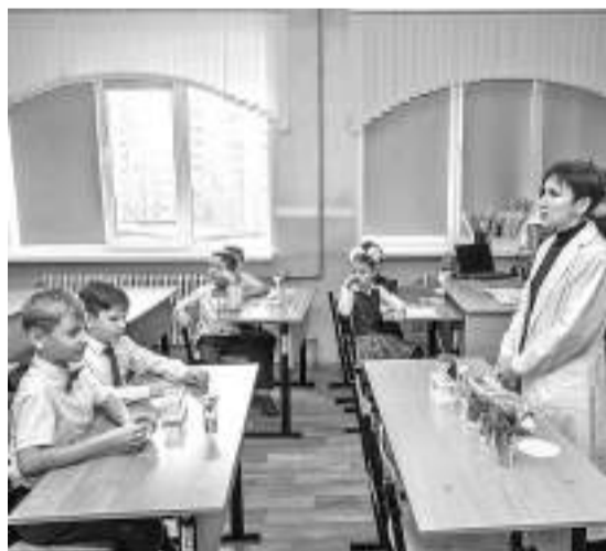
Шуховцы изучают кислотность почв